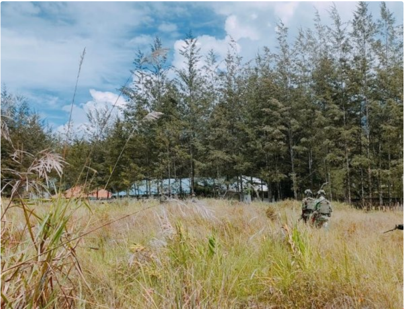
Satgas Yonif 323 Amankan Anggota OPM terduga pelaku tindak Kriminal

Satgas Mobile Yonif 323/Buaya Putih Kostrad berhasil menangkap salah satu