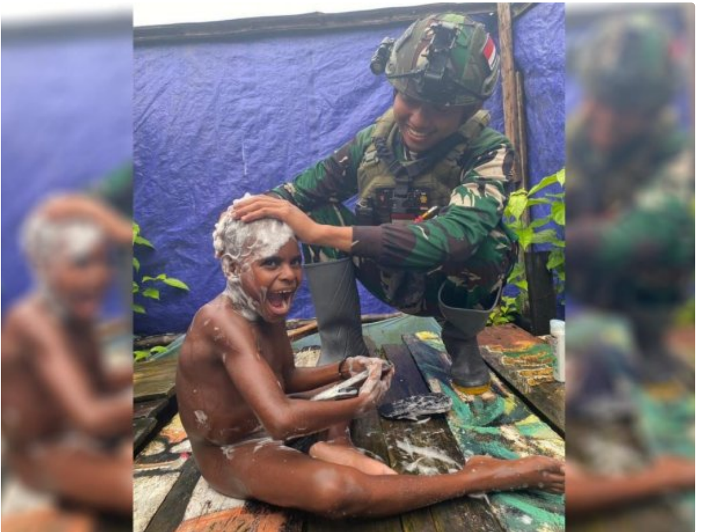
Foto: Saat Satgas Pamtas Mobile RI-PNG Yonif 503/Mayangkara Koops Habema Mengajarkan Anak-anak Menjaga Kebersihan Dengan Mandi Air Bersih di Pos Batas Batu, Kecamatan Batas Batu, Kabupaten Nduga, Papua Pegunungan, Kamis (04/07/2024).

NDUGA- Satgas Pamtas Mobile RI-PNG Yonif 503/Mayangkara Koops Habema